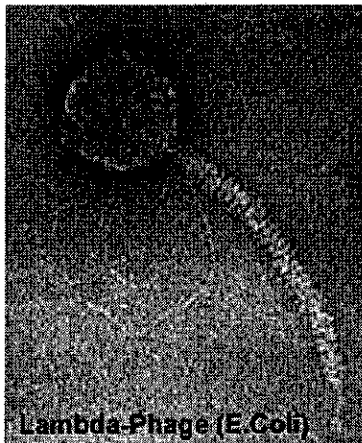
Lambda-Phage (E. coli)

Briefanschrift Postfach 6 06, 91511 Ansbach